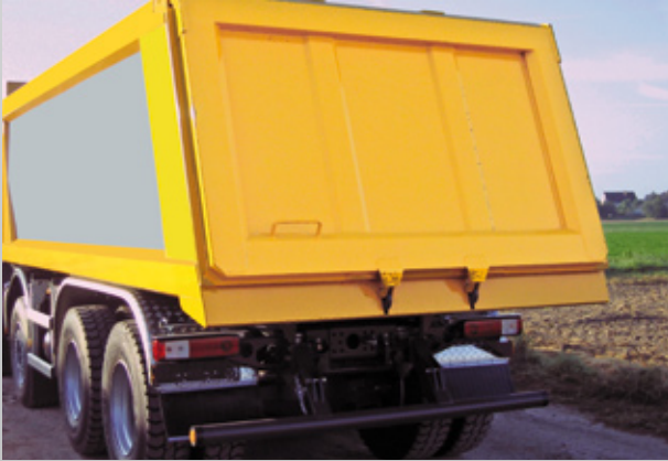
Gegenliegende Rückwand gesickt