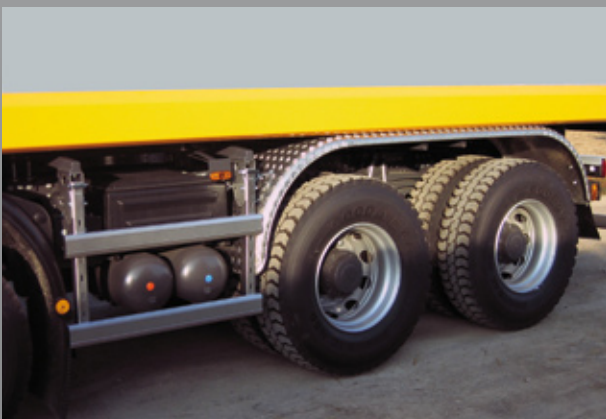
Seitenanfahrtschutz, durchgehende Alu-Kotflügel