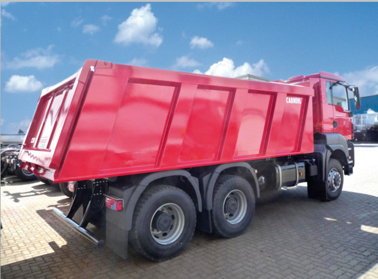
Hardox-Kastenmulde in Spantenbauweise