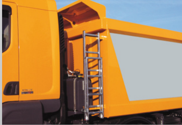
Schutzdach und klappbare Aufstiegsleiter