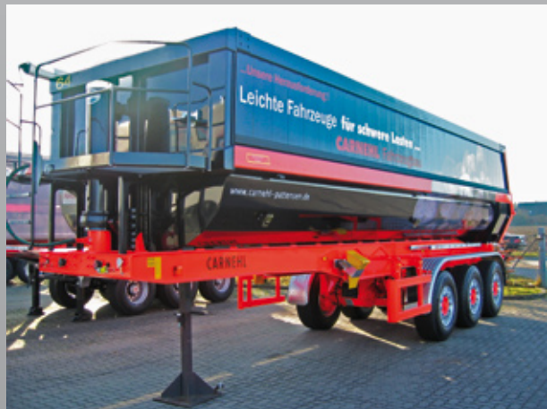
Sicherheitspodest zur Planenbetätigung