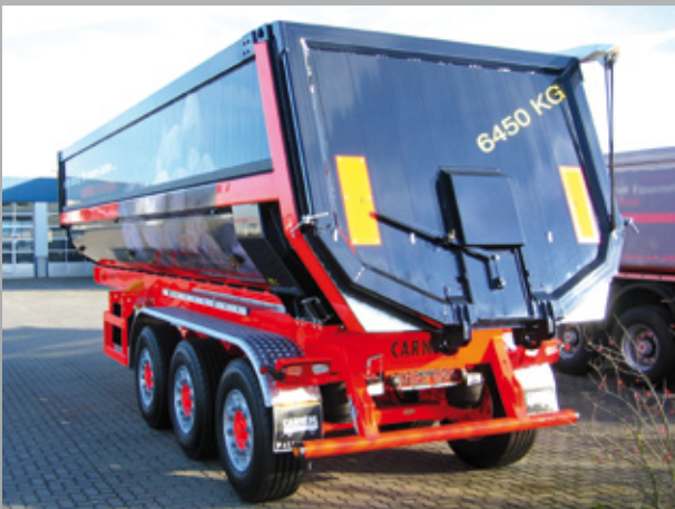
Alu-Rückwand mit Getreideschieber