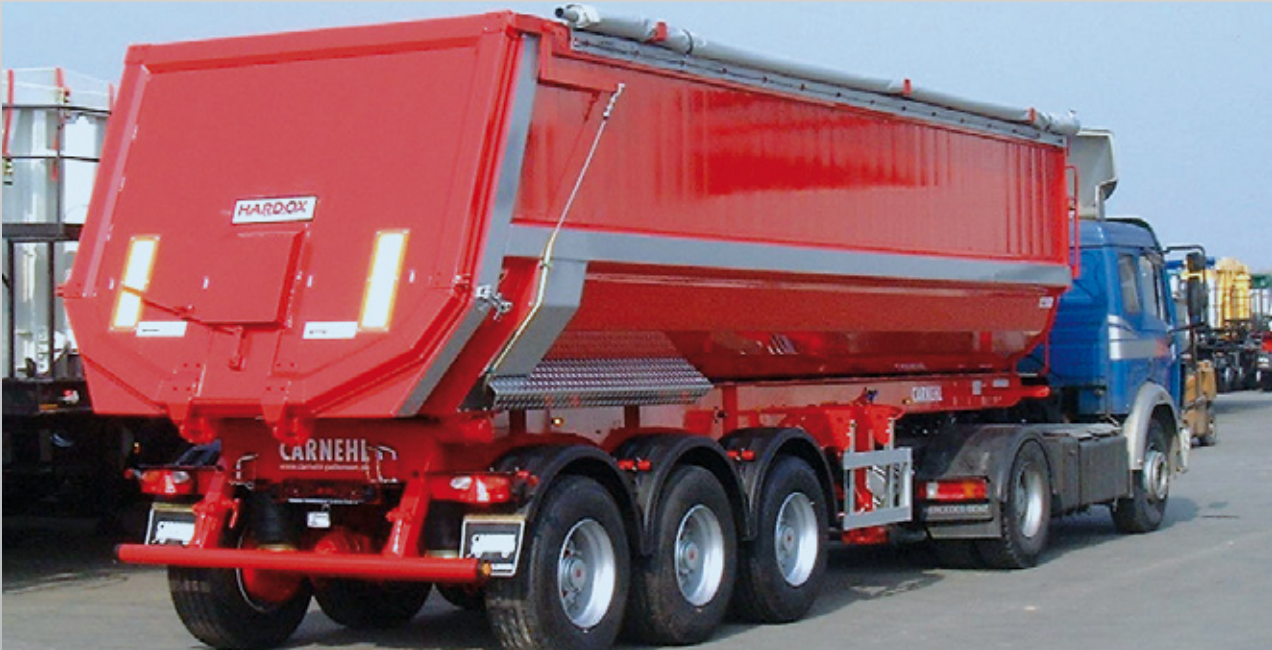
Halbschalenmulde aus Aluminium u. Hardox-Stahl