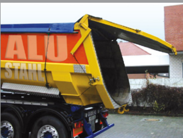
Rückwand mit pneumatischer Öffnung über Seilzug